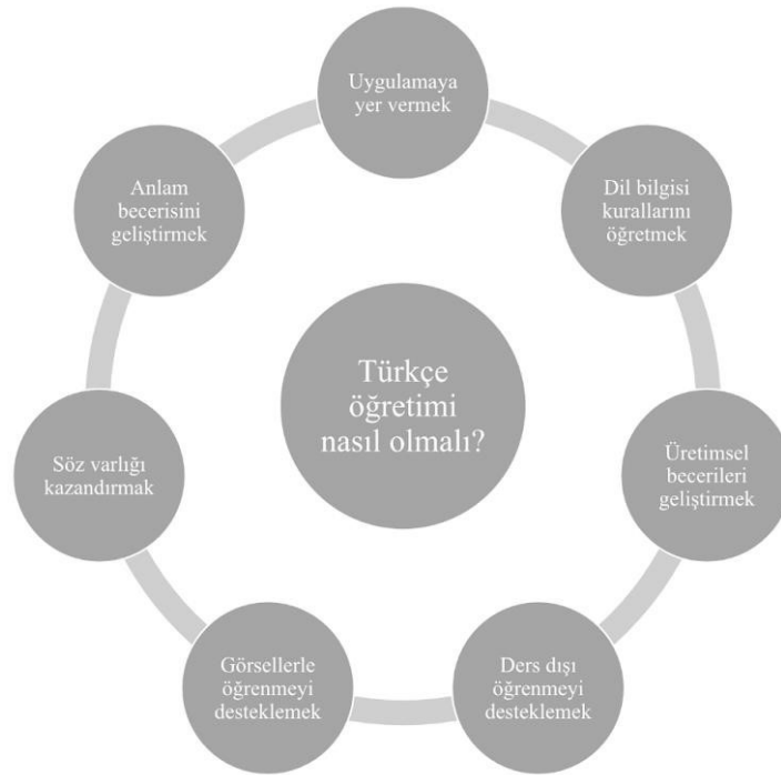
ŞEKİL 1.1. 1. Alt Probleme İlişkin Şema Dağılımı

Uluslararası öğrencilerin, öğretici yeterliklerine ilişkin görüşlerini tespit etmeyi amaçlayan çalışmanın bu bölümünde görüşmelerden elde edilen verilerin analizi yer almaktadır.