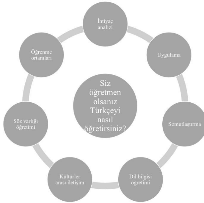
Şekil 3. 3. Alt probleme ilişkin tema dağılımı

Şekil 3’e bakıldığında katılımcıların görüş birliğine vardığı tema adlarının “ihtiyaç analizi”, “uygulama”, “somutlaştırma”, “dil bilgisi öğretimi”, kültürlerarası iletişim”, “söz varlığı öğretimi” ve “öğrenme ortamları” olduğu anlaşılmaktadır. Bu temaları oluşturan ifadeler Tablo 6’da gösterilmektedir.